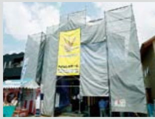
見学するのはモデルハウスではなくリアルな現場。ありのままの姿で判断を