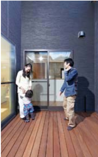
お子さんの遊び場にもなる、家族団らんの空間は、光と風に包まれる中庭（コート）