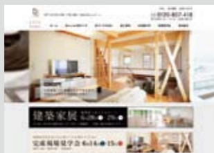
スッキリと見やすくなったホームページにはイベントなどのお得情報が随時紹介

お客様の要望に応えるホスピタリティの高い当社では、家づくりに役立つセミナーやイベントが、随時わかりやすい方法で提供される。随時わかりやすい方法で提供される。随時わかりやすい方法で提供される。