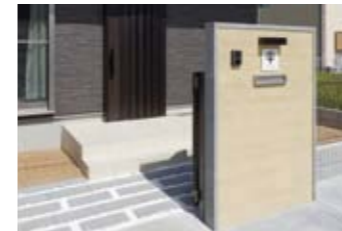
エクステリアも一工夫。玉砂利を敷いて、外観と調和する和風モダンスタイルを提案