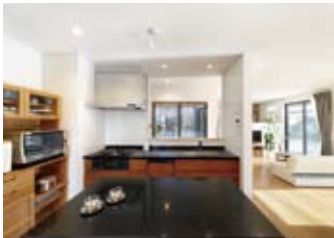
お揃いの作業台は使い勝手が抜群。中庭に面して設計された開放的で明るいキッチン