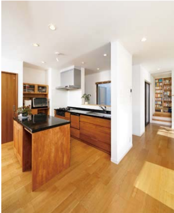
白い壁とブラックチェリーの無垢床でナチュラルモダンな空間が実現。キッチンを中心にそれぞれの空間がつながる設計も、コンパクトな動線で家事ラクの家に