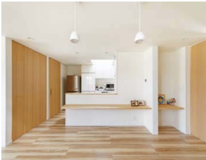
キッチンに向かって左側が、バスルーム、洗面所、物干しスペース。右側は、細々したものをスッキリ隠せる家事コーナーや大型収納。回遊できる動線がとても便利