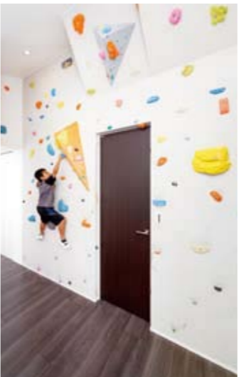
登山が趣味の夫の要望で、壁にカラフルな石をはめ込んだボルダリングの練習場も実現