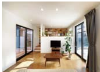
LDKも見渡せ、収納もたっぷり。リビングの床から2段高い位置に書斎スペース