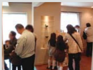
見学会で感じた性能の高さや使い勝手のいいプランが決め手になる方もたくさん

モデルハウスは所有せず、実際に建てた家をそのまま「完成現場見学会」として公開。開催告知や展示物も、スタッフが手づくりすることで余計な経費をかけないように工夫。少しでも建築コストが抑えられるようにするなど、徹底して「お客様の建築費を1円も無駄にしない」という姿勢を貫いている。