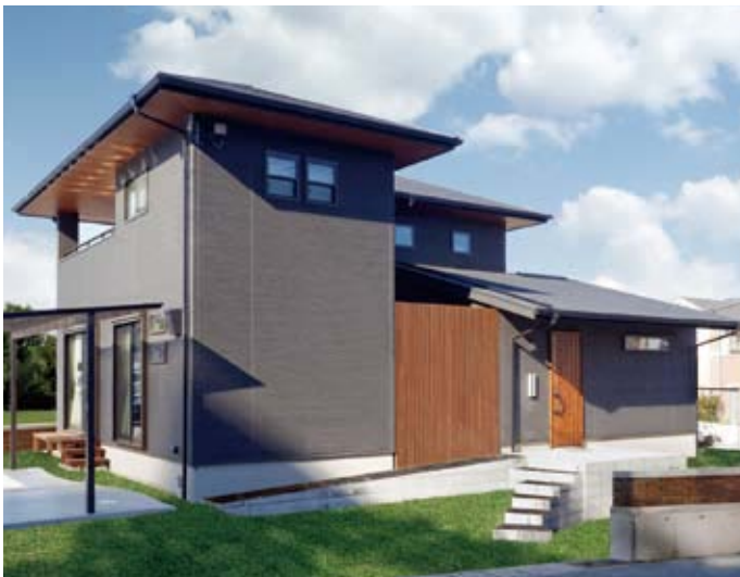
ダークグレーの外壁に、木目調の軒裏天井をあしらったナチュラルモダンスタイルで建築。中庭（コート）にはウッドフェンスを設け、「目隠し」兼外観デザインのアクセントに