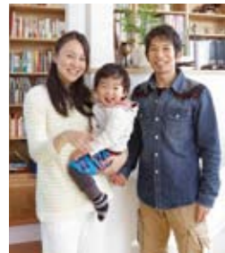
「デザインも快適さも叶えた、大満足の家になりました」とFさん

A 「外が見えるキッチン」を希望したところ、中庭を囲むコートハウスを提案していただきました。また一段高い書斎コーナーもお洒落に実現。風が通り、光いっぱいのお住まいになりました。