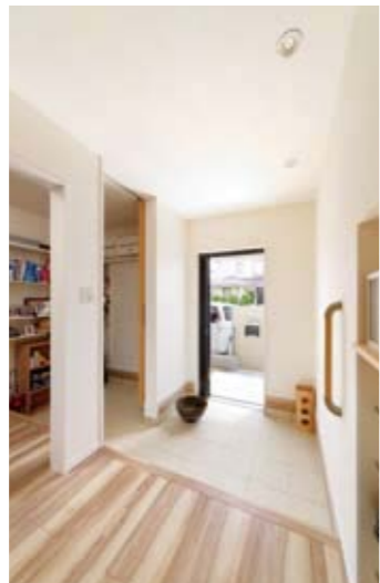
広い玄関はリビングに直結する他に、大型収納を通してキッチンにつながる2WAY動線