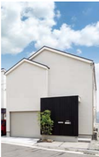
ビルトインガレージも実現。外からの視線や夜間のライトを遮るよう、窓のない設計に