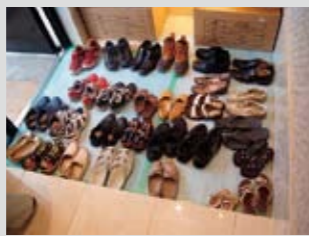
初めての参加も、何度も参加している方も大歓迎。気軽に参加できるのも魅力