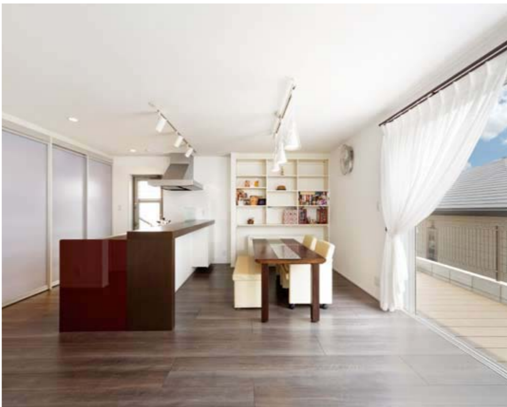
高台の立地を活かし、南側から光がたっぷり入る開放的なオープンキッチンを提案。畳スペースの段差を活かした大型収納や、壁面を活かした造作棚など、家具を置かなくてもスッキリと暮らせる収納も丁寧な手仕事で実現した(このページで使用した写真はすべてK氏邸)