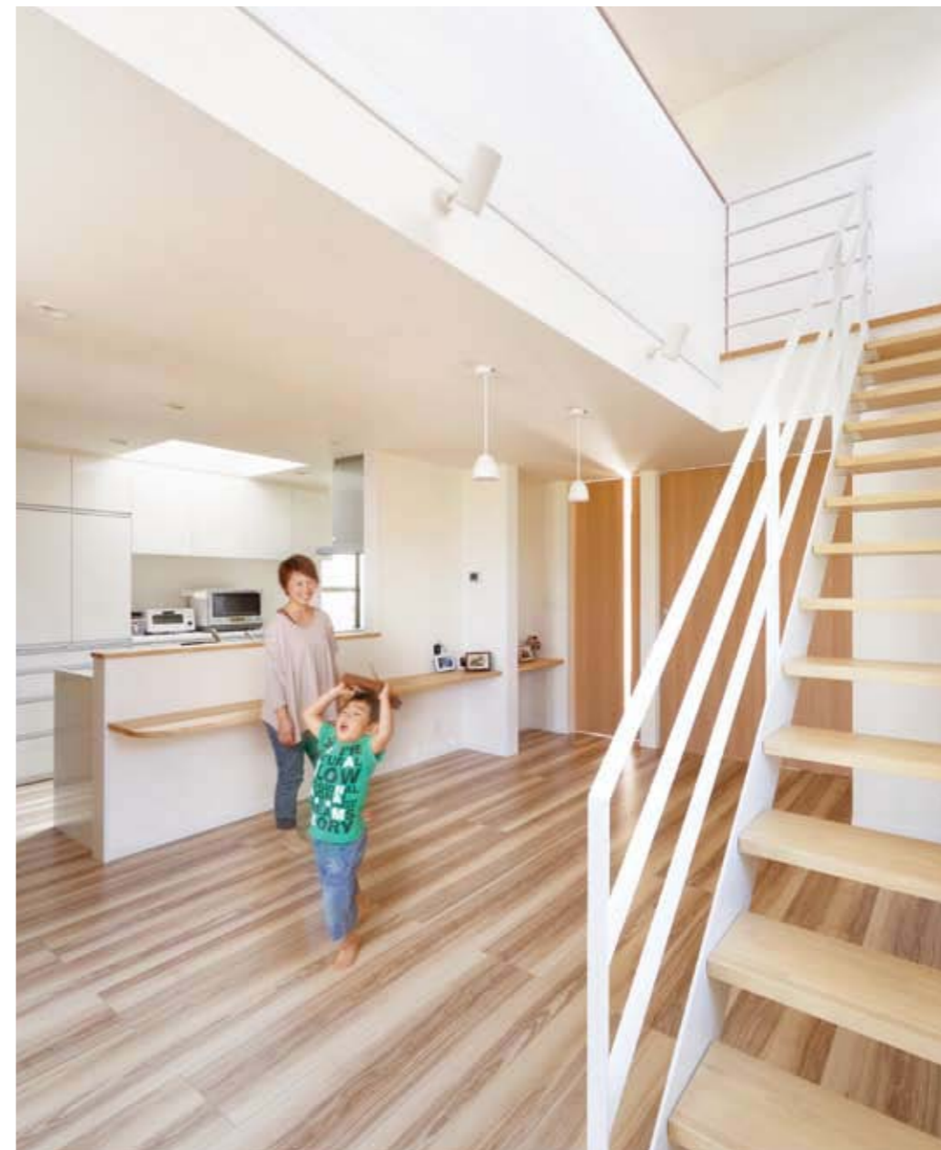
同社との出会いは知人のアドバイス。暑がり屋さんの夫の話をする、「夏は涼しく、冬は暖かい。そんな家があるらしいよ」。その後、現場見学会に参加。見えない配線にまで心を行き届かせる同社のこだわりと、いい家が誕生する現場を目の当たりにして、依頼を決めた