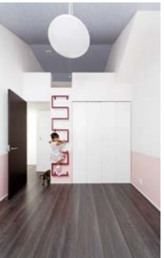
梯子は同社の提案で、衣紋かけにも、インテリアの一部にもなる、色やデザインで造作