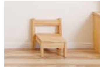
造作工事が得意。お子さんがいつも使っているお気に入りの椅子も大工さんの手づくり