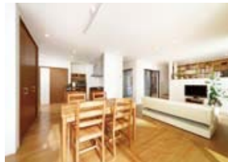
造り付けの収納家具もたっぷり。洗練のデザインで、スッキリと暮らせる家を実現