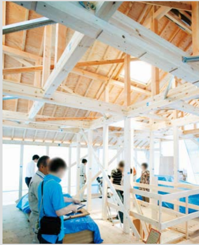
月に1度のペースでコンスタントに開催される「構造見学会」(写真)や「完成現場見学会」。SE構法が叶える開放感や、通気断熱WB工法による快適な室内環境を確認しよう