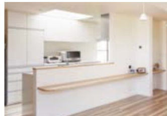
同社の提案で天窗を設計。頭上から自然光が降り注ぐ、爽やかなキッチンが完成した