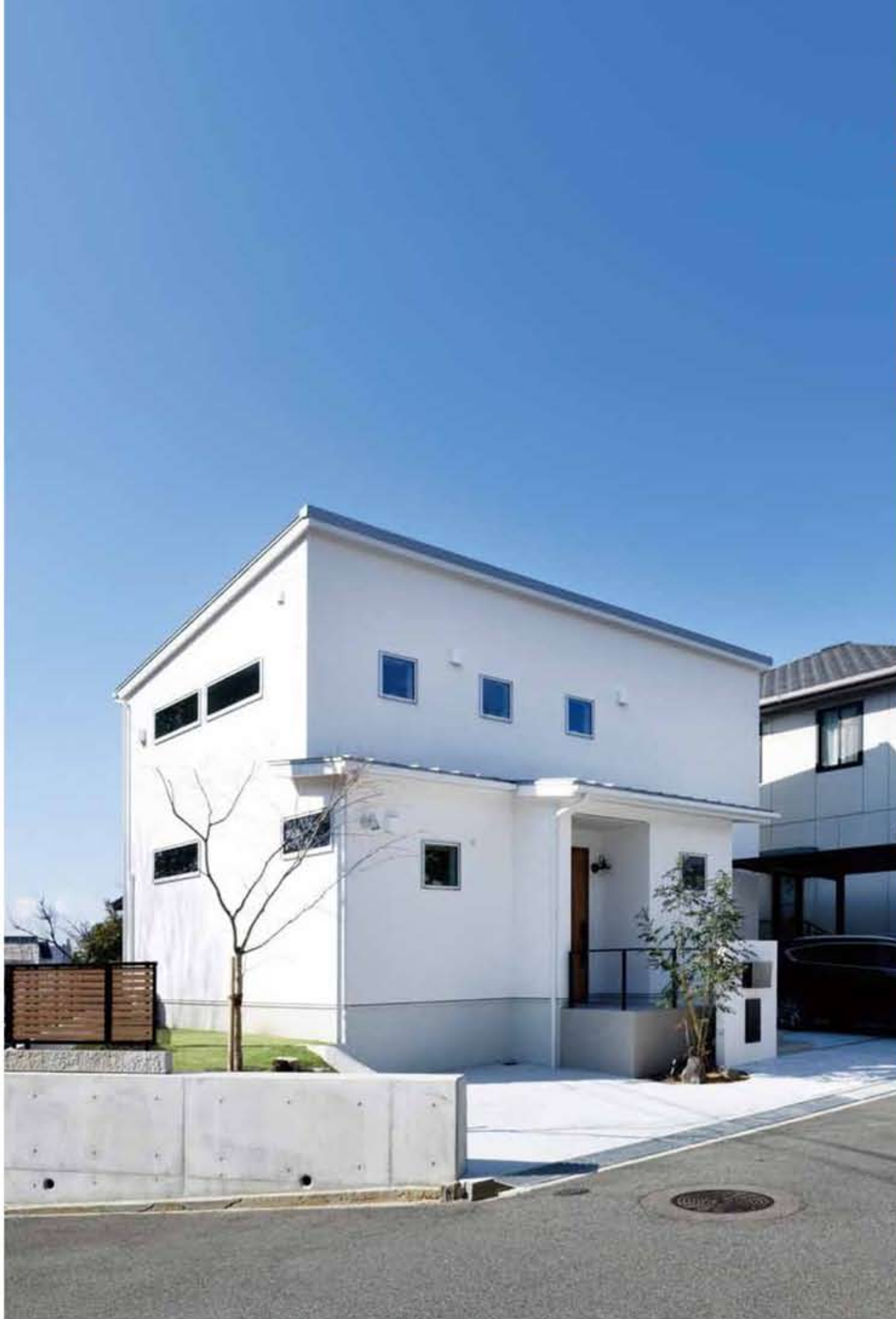
太陽光パネルを載せた片流れの屋根に空の青と芝生の緑に映える真っ白の外壁。閑静な住宅街の角地に建つMさん家族の住まい。断熱・気密性や耐震性にも優れた住まいになっており、「一度部屋が温まったらエアコンを切っても当分暖かいんです」。セルロースファイバーの効果を実感しているという（見開きの写真はすべて兵庫県M氏邸）