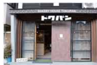
パン BAKERY HOUSE TOKUPAN

〒657-0846 神戸市灘区岩屋北町2丁目4-6 070-7489-3313 定休日 日曜日・不定休