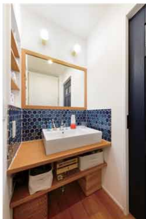
こだわって選んだタイルがお気に入りの造作洗面。

A9. 最初は地元の「工務店」ということで実績面において正直不安もあったのですが、結果的にはお任せして大正解だったと思っています。大手のハウスメーカーに相談していたときは様々ながらみがあるのか選択肢が乏しかったように思いますが、あんじゅホームの場合は自由に融通を利かせることができました。そのため、ほとんど私たちが希望する一軒家を建てていただけたと感謝しています。今考えてみるとハウスメーカーにはない工務店ならではの自由さやこだわりが私たちにピッタリでしたね。