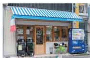
イタリアン Pizzeria RICCA

〒657-0838 神戸市灘区王子町1丁目3-23 レインボープラザ102 078-262-1292 定休日 水曜日・火曜日ディナータイムのみ