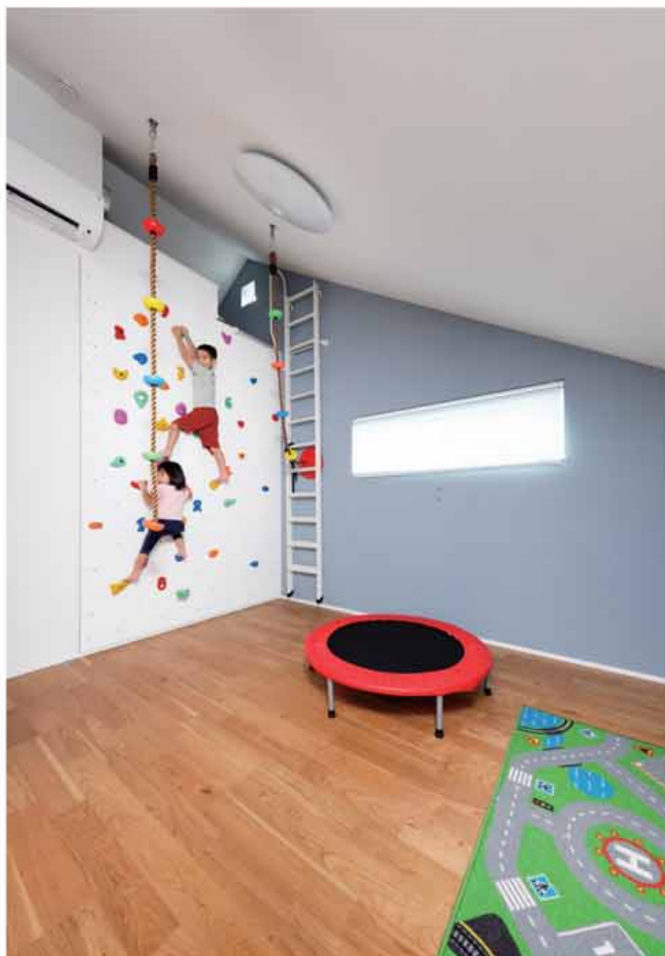
子供部屋には、勾配天井を活かしたおうち時間を愉しむ仕掛けを。ロフトの壁を利用したクライミングウォールやブランコを設置。