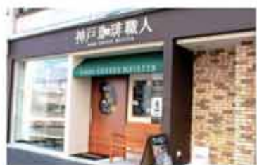
カフェ 「神戸珈琲職人」のカフェ 神戸本店

〒657-0841 神戸市灘区灘南通6丁目2-20 078-871-1189 定休日 土曜日・日曜日・祝日