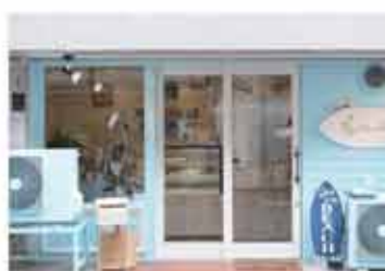
ケーキ 小さなお菓子専門店 ファリリィ

〒657-0035 神戸市灘区友田町4丁目1-23 078-806-8242 定休日 不定休