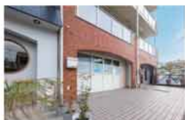
便利屋業 いつもの便利屋

〒658-0045 神戸市東灘区御影石町2-13-20-203 0800-888-4694 定休日 不定休