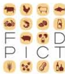
コンサルティンググループ フーズフーズ

〒657-0831 神戸市灘区水道筋3-4 (水道筋商店街 灘中央市場内) URL: https://www.whosefoods.co.jp/