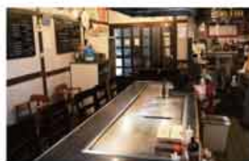
韓国料理 韓国料理 jinan

〒657-0831 神戸市灘区水道筋3丁目1番地 078-891-7077 定休日 月曜日