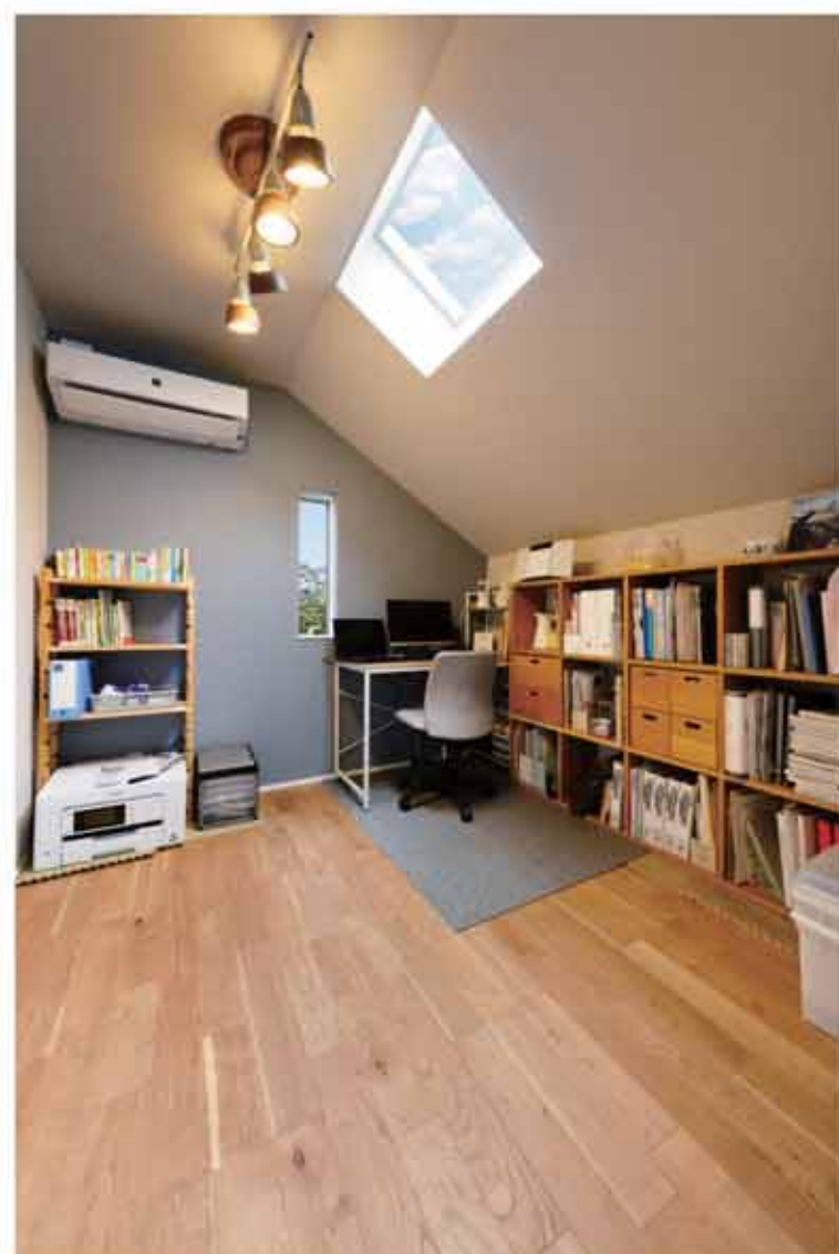
主寝室横に設けられたワークスペース。法的な制限で低くなった天井高でも、ワークスペースなら集中できる空間に。