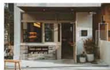
カフェ CHARMANT Cafe & COFFEE ROASTERY