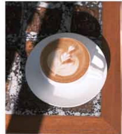
朔コーヒー人気のハンドドリップはオーナー自ら1杯1杯心を込めて淹れています