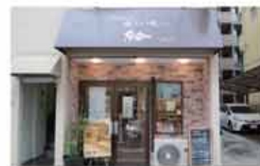
パン 食パン専門店 結-YUI-

〒657-0838 神戸市灘区王子町1丁目1-15 078-862-3900 定休日 水曜日