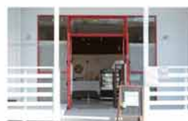
パウンドケーキ Cutiful (キューティフル)

〒657-0059 神戸市灘区篠原南町5-5-14 078-891-8810 定休日 不定休