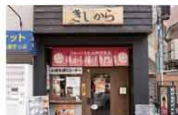
からあげ きしから 灘・岩屋店

〒657-0846 神戸市灘区岩屋北町4-3-10 1F 078-806-3550 定休日 不定休