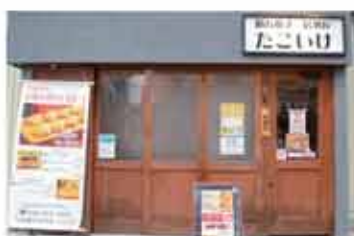
明石焼居酒屋 明石焼居酒屋「たこいけ」

〒657-0838 神戸市灘区王子町1丁目3-23 078-585-7350 定休日 月曜日・木曜日