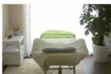
サロン メイクアップSiesta (シエスタ)