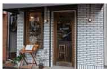
ワイン IN VIAGGIO

〒657-0836 神戸市灘区城内通5丁目2-4 078-223-3689 定休日 不定休