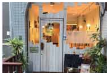
カフェ Teacafe Colour

〒657-0838 神戸市灘区王子町1丁目2-21 サンビルダー王子公園101 078-882-6010 定休日 木曜日