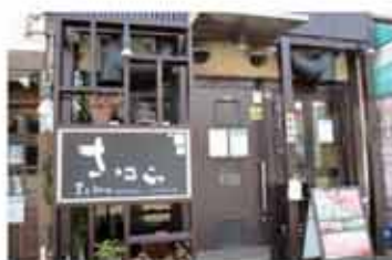
焼肉 黒毛和牛焼肉 さはら

〒657-0821 神戸市灘区赤坂通5丁目3-11 078-802-8929 定休日 月曜日 (月曜日が祝日の場合は 火曜日休み)