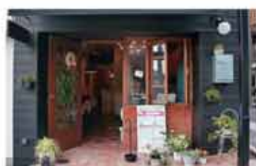
ガレット・クレープ LE MARRON

〒657-0064 神戸市灘区山田町2丁目1-12 078-855-4317 定休日 日曜日