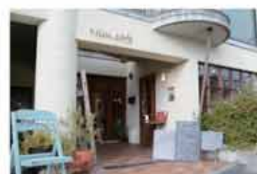
カフェ Nim.cafe (ニムカフェ)

〒657-0825 神戸市灘区中原通6丁目1-15 078-806-3707 定休日 火曜日