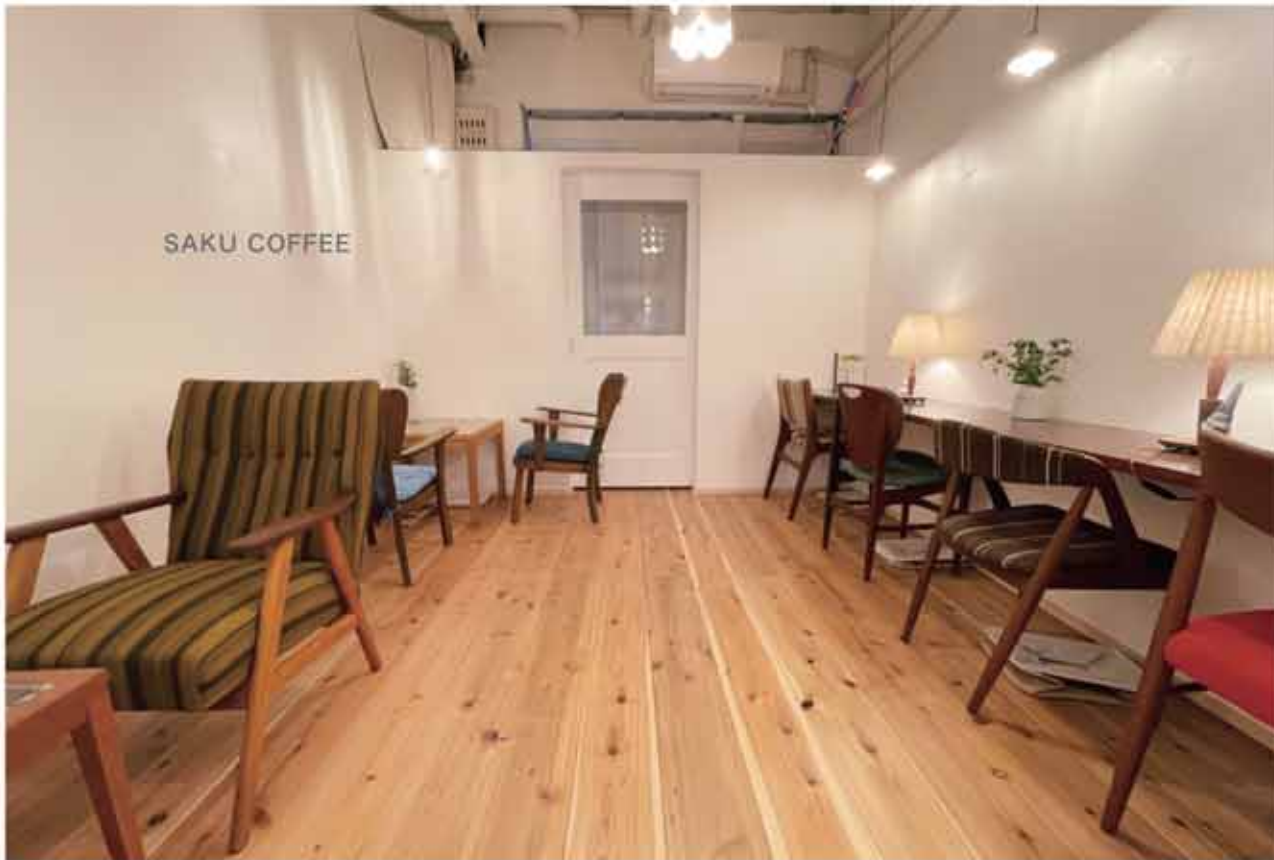
絵本の世界をイメージして作られたカフェコーナーはほっと一息つける優しい空間