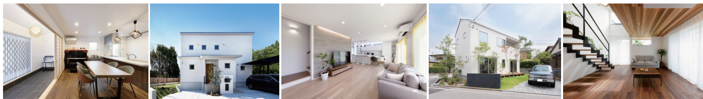
※上記写真は当社施工例です。今回の見学会の住宅とは異なります。

「オール電化住宅」は光熱費削減につながるというメリットの他にも、火元を使用しないため、火事やガス漏れ・ガス爆発などのリスクを減らすことができるというメリットがあります。近年、共働きのご家庭が増えており、日中にお子様だけで留守番したり、ご高齢の家族と同居することも増える中、安心して生活することができます。