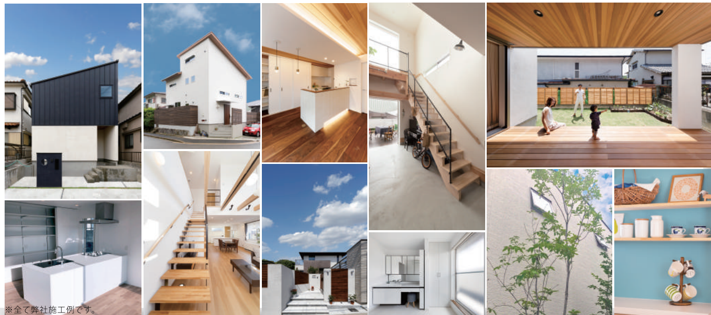
※全て弊社施工例です。

「長期優良住宅」は、国が「次世代の住宅」のあり方を示したもので、これまでの建築基準法住宅に備えるべきもののレベルを上げ、長寿命の住まいをストックしていくというものです。そこで中心となっているのが「住宅の性能」です。耐震性、省エネルギー性、耐久性といった性能は、何より良質な住宅の基盤になるものだからです。あんじゅホームの家づくりではこの「長期優良住宅」を基準として、さらに独自の工夫を取り入れています。