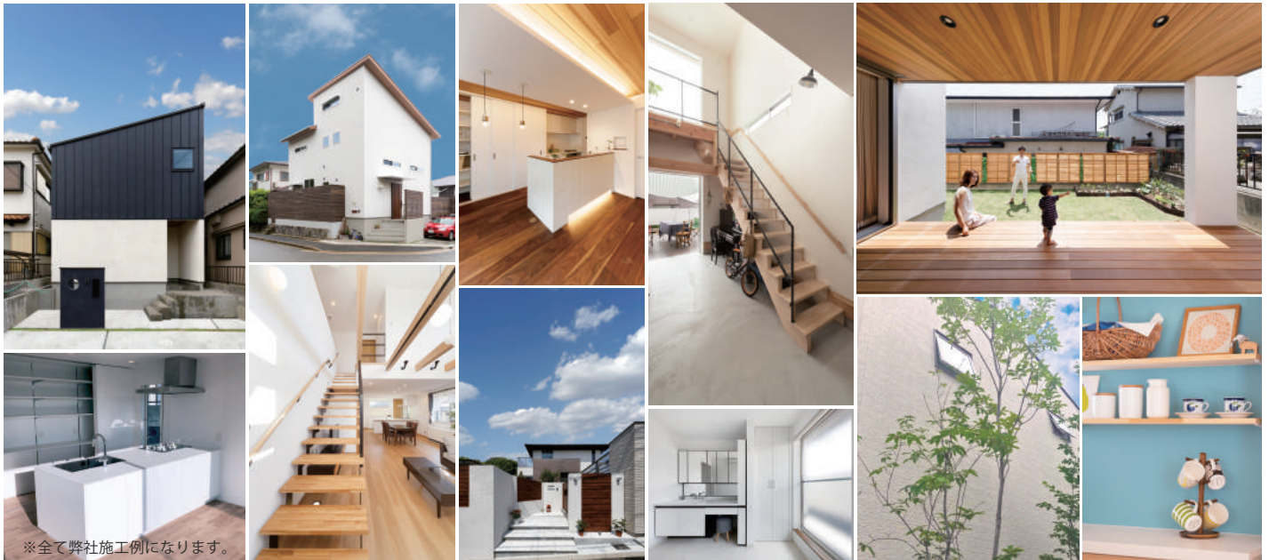
※全て弊社施工例になります。