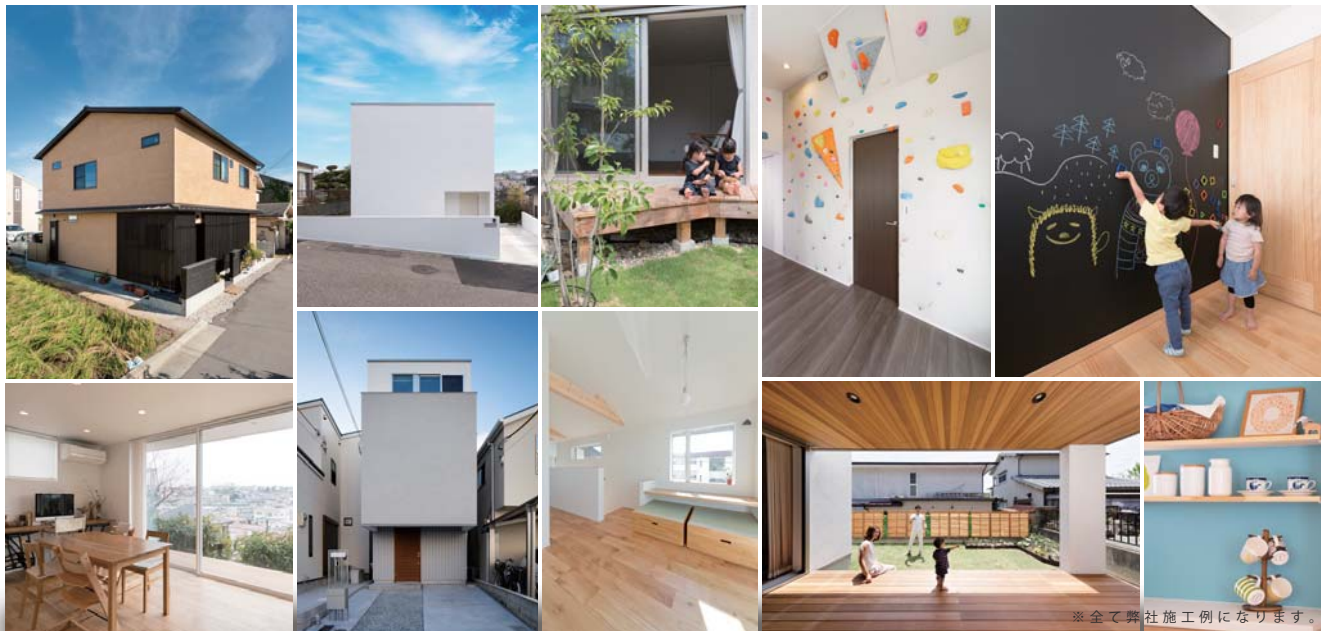
※全て弊社施工例になります。

ものづくりへの真摯な精神を忘れることなく、 家づくりの道を極めていけるように。 そんな想いをカタチにしたロゴになっています。