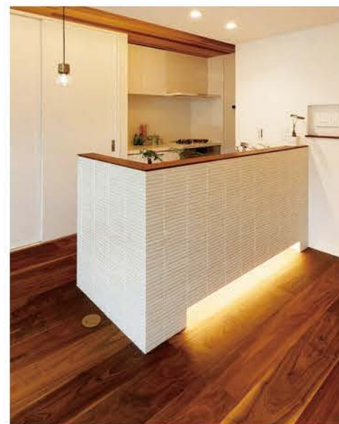
タイル貼りや間接照明で、素敵にアレンジ