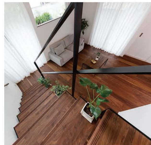
吹抜けを介して光が落ちる設計。リフォーム後は気持ちいい家に