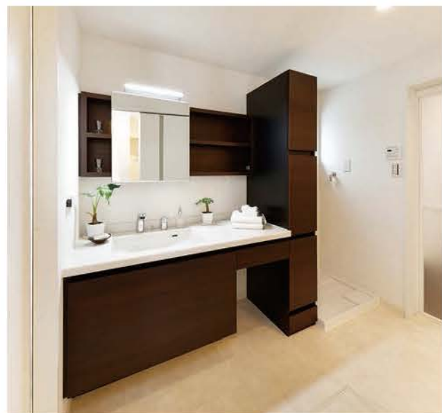
安心品質の国産メーカー設備を選んでも、ひと手間かけて、スッキリと仕上げ