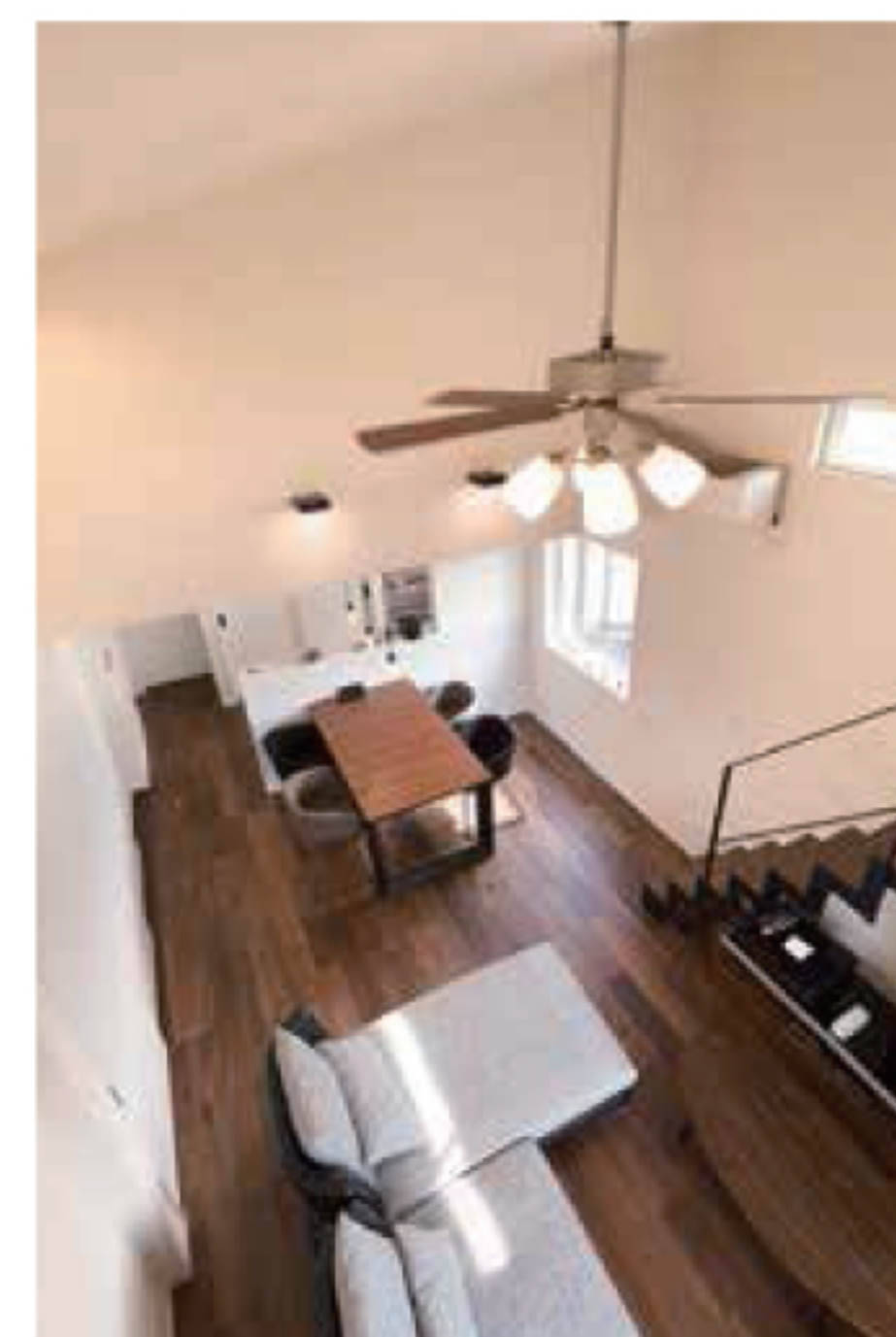
2階+ロフトは子ども世帯の空間。デザインもカフェ風