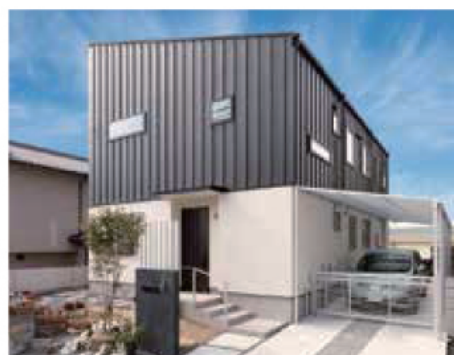
施工例を参考にして、ガルバリウム鋼板を使った外観に

夫も妻もフルタイムの仕事に就いているTさん。「子どもが一人で帰りを待つのは寂しそう」と実家を二世帯住宅にすることに。依頼先は、お隣も建て替えを依頼されたArts+(あんにゅホーム)。「こちらの要望を聞いてくれてさらに提案もしてくれる。二世帯住宅の実績が多いので、気兼ねしない間取りなど、アドバイスいただけました」。