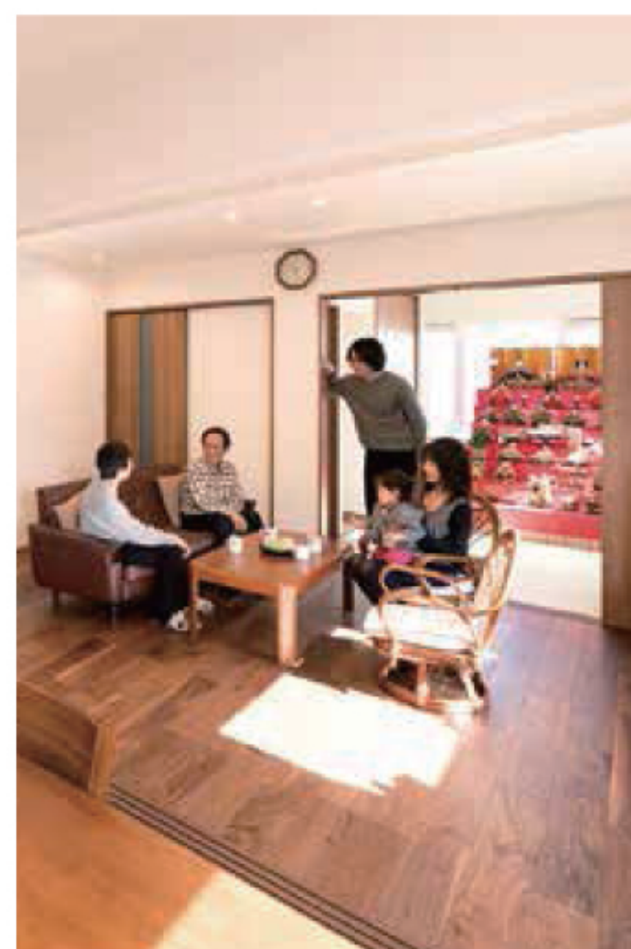
ひな祭りは親世帯のリビングが舞台。姉家族も集まった