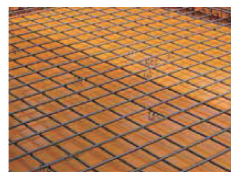
防筋の美しさでも圧倒。しっかり建てる施工力も魅力

「予算には限りがあるが、後悔しないいい家を作りたい」「品質のいいものを選び、ながく使いたい」という方の想いに応え、ハイグレードな標準仕様(35坪・2000万円)を用意。耐震性能は最高等級の【耐震3】で、外壁通気工法で建築し、外壁材やサッシ、玄関ドアや建具なども、将来のメンテナンスに手間やコストがかからないものを厳選。これをベースに要望に合わせて細やかに対応。