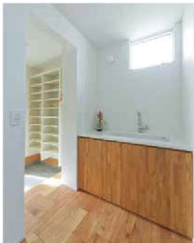
洗面化粧台をはじめ造作家具類の完成度もさすが