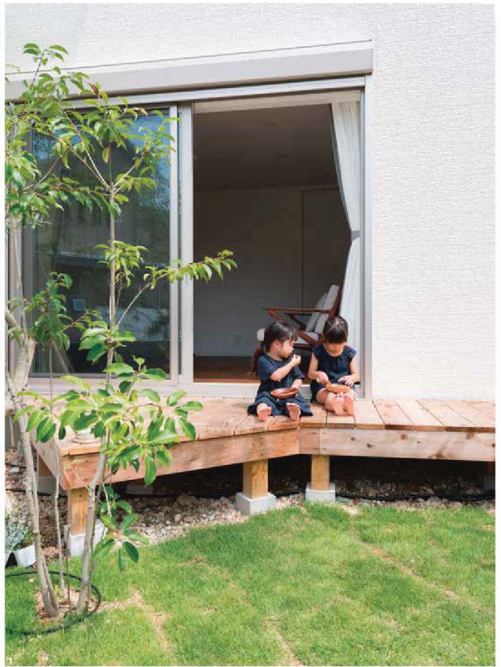
1/購入を決めた土地は想定していた以上に広がったが、設計士が提案した、敷地に対して斜めに配置するプランを見て閃いたというNさん。「この広い土地を買っても敷地いっぱいには建築せず、木々が育つ庭スペースを広く設けるのもいいな、と。実が成る木が育つと鳥たちも訪れますし、楽しそうですよ。そんな庭づくりも一緒に計画しました」(Nさん) 2/リビングも庭につながるよう設計 3/キッチンは壁づけにし、空間を広く活かせるようにした 4/玄関は広い土間仕様。家族分の靴や自転車などもたっぷり収納できる(見開きで使用した写真はすべてNさん邸)