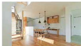
居心地のいい家族の時間(=距離感)を大切に提案

1 / デザイン自体はシンプルだが、床は無垢材、壁はしっくい塗りと、自然素材をふんだんに採用。「冬でもあたたかい家」「地震に強い家」「自然の恵みを取り入れた家」を柱に、必要十分な広さに留めることで初期コストを圧縮 2 / 身の丈サイズを意識したコンパクトな家事動線と使い勝手のいい収納計画 3 / 暮らしのストレスをなくすことで、精神的な豊かさをつくりだす(見開きで使用した写真はすべて、「SUBACO(スパコ)」モデルハウス)