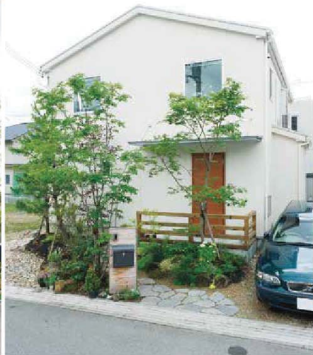
快適な性能、暮らしやすい動線、好みのデザイン。どんな要望でも、実現できる方法を考えてくれる真摯な会社。通気断熱WB工法や耐震構法SE構法などにも対応している(同社施工例)