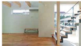
無垢フローリングとドイツ仕のやさしい空間