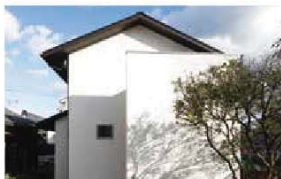
7台分の駐車スペースがあるので車で来場もOK

狭小住宅ではなく、敷地に対してちょっと小さめを意識した設計が「SUBACO」。神戸市垂水区歌敷山には、必要以上の広さへの執着を手放すことで叶えられる豊かさは何か、が体感できるモデルハウス※がOPEN(見学は要予約)。担当した設計士や現場監督から開発秘話が聞けるかも。