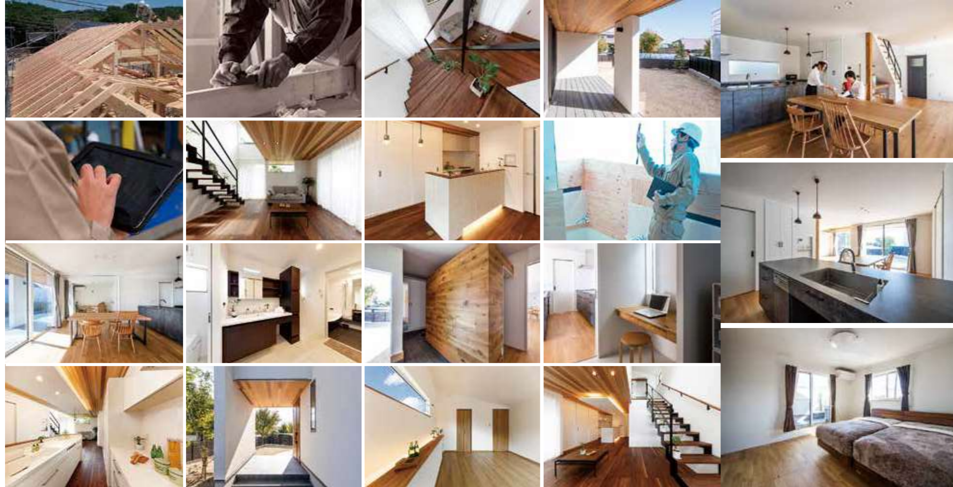
デザインも性能も追求したいからこそ、現場の施工力が問われる注文住宅。熟練した職人の技と厳しい施工管理のもと、安心・安全・長寿命な家を提供する（すべて施工例）