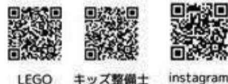
LEGO キッズ整備士 instagram